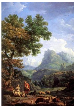
К. Верне. Пейзаж

Птичьи голоса звучат в пьесах для клавесина «Перекликание птиц» и «Курица» Жана-Филиппа Рамо, «Кукушка» Луи-Клода Дакена, в фортепианной пьесе «Песня жаворонка» из цикла «Времена года» Чайковского, в прологе оперы «Снегурочка» Римского-Корсакова и во многих других произведениях. Итак, подражание звукам и голосам природы - самый распространённый приём изобразительности в музыке.