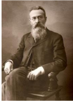
Николай Андреевич Римский-Корсаков

Одна из самых ярких и величественных музыкальных картин создана Бетховеном. В четвёртой части своей Шестой («Пасторальной») симфонии композитор звуками «нарисовал» картину летней грозы (эта часть так и называется - «Гроза»). Слушая могучее crescendo усиливающегося ливня, частые раскаты грома, вой ветра, изображённые в музыке, мы представляем себе летнюю грозу.