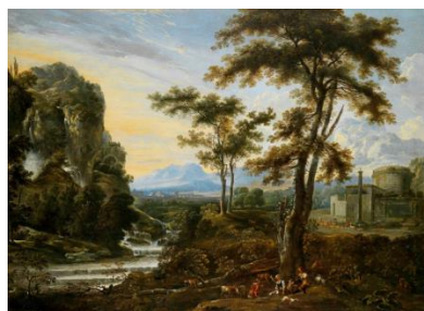
Я. Ван. Пейзаж

В симфонической картине Римского-Корсакова «Три чуда» изображена морская буря (второе «чудо» - о тридцати трёх богатырях). Обратите внимание на авторское определение - «картинка». Оно заимствовано из изобразительного искусства - живописи. В музыке слышны грозный рокот волн, завывание и свист ветра.