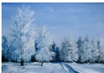
А. Андреев. Зимняя дорога

Ярко и афористично «написаны» женские портреты-характеры в фортепианном цикле Роберта Шумана «Карнавал». Сравним два из них: «Кларина» и «Эстрелла». Что в них общего? Прежде всего, романтический жанр вальса - танца века. Его «полётность», изящество как нельзя более точно подходят к женским образам, но при этом характер двух вальсов резко различен. Под карнавальной маской «Кларины» проступает портрет Клары Вик, жены композитора, выдающейся пианистки. Сдержанно-страстная тема вальса выражает возвышенную одухотворённость, поэтичность музыкального образа. А вот другой вальс – «Эстрелла», и перед нами «участница» карнавала, совершенно непохожая на «Кларину», - темпераментная, пылкая девушка. Музыка исполнена внешнего блеска, яркой эмоциональности.