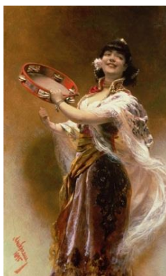
А. Шрам. Девушка с тамбурином

Не малое место в музыке занимают музыкальные портреты. «Рисовать» их первыми научились французские композиторы XVIII века. Франсуа Куперен многим своим пьесам для клавесина давал названия. Автор писал: «Пьесы с названием являются своего рода портретами, которые в моем исполнении находили довольно похожими». Слушая пьесу «Сестра Моник», нетрудно представить её весёлый нрав.