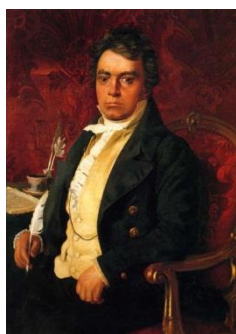
Людвиг ван Бетховен

...Какой океан звуков окружает нас! Пение птиц и шелест деревьев, шум ветра и шорох дождя, раскаты грома, рокот волн... Все эти звуковые явления природы музыка может изобразить, а мы, слушатели, представить. Каким образом музыка «изображает» звуки природы?