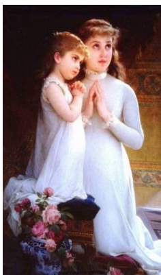
Э. Минье. Молитва

Если, к примеру, вы откроете «Детский альбом» Чайковского и прочитаете название первой пьесы: «Утренняя молитва», то сразу настроитесь на определённый тон, строгий, светлый и сосредоточенный. Заголовок помогает исполнителю раскрыть характер музыки наиболее близко к авторскому замыслу, а слушателю - лучше воспринять этот замысел.